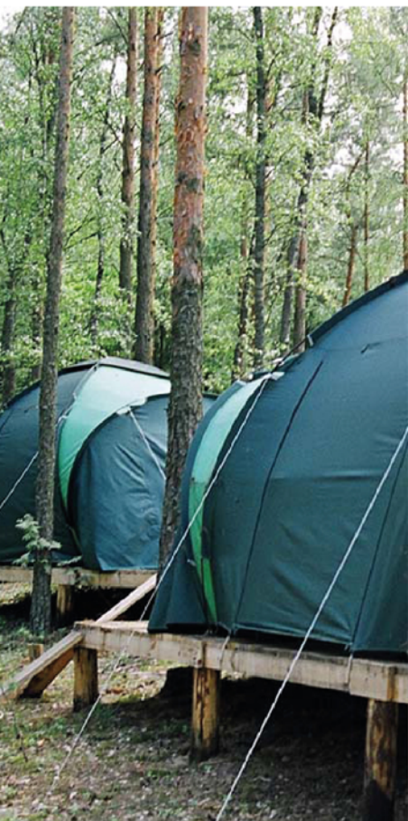
ПАЛАТОЧНЫЙ ЛАГЕРЬ НА 100 ЧЕЛОВЕК