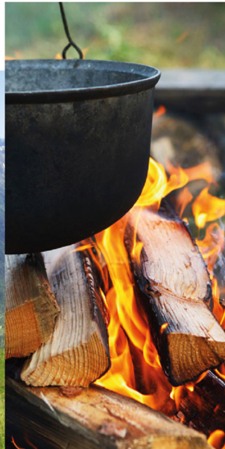
3 ПЛОЩАДКИ ДЛЯ ПРОВЕДЕНИЯ ТИМБИЛДИНГОВ